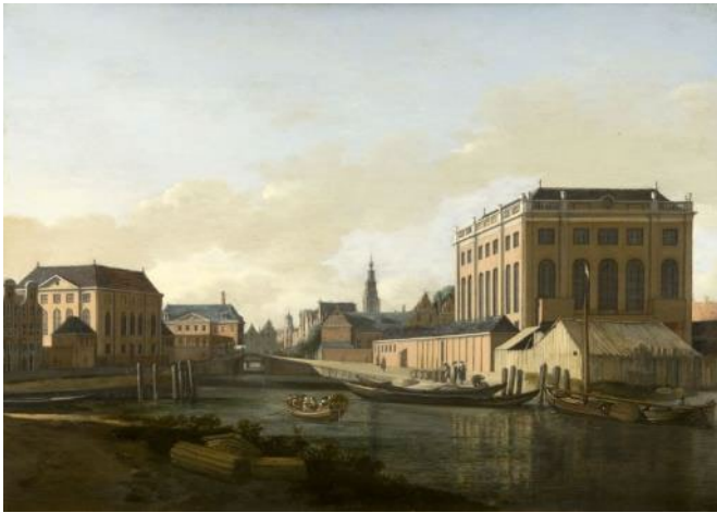
Gerrit Adriaenszoon Berckheyde, Gezicht op de Grote en Portugese Synagoge te Amsterdam, 1675-1680.