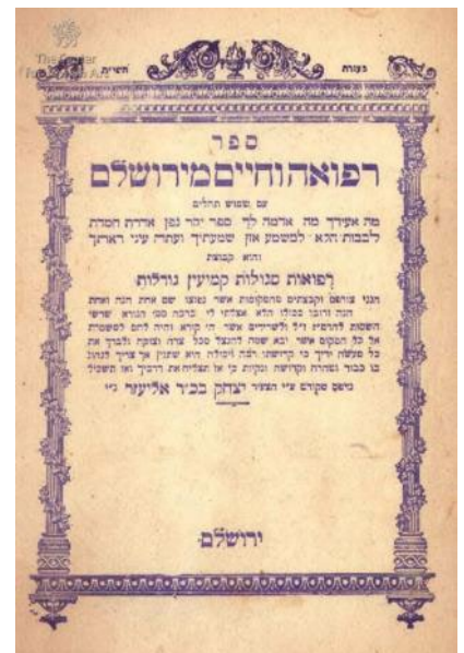
Moderne remedieboek in het Hebreeuws, ca. 1950. Gross Family Collection No. B.1894.

Tijdens de vroegmoderne tijd zorgde de Jiddisch druk industrie voor de verlichting van alle Asjkenazische joden die de Hebreeuwse taalbronnen onvoldoende begrepen. Daaronder waren ook Jiddische Refue Bikher . Bij mijn onderzoek van de Jiddische medische boeken komen de twee trefwoorden Refues (Remedies) en Segules (mystieke charmes) vaak samen voor. Juist zoals lichaam en ziel, zijn remedie en vroomheid integraal met elkaar verbonden. Terwijl lichamelijke ziekte voortkomt uit zowel natuurlijke als onnatuurlijke oorzaken, is de ziekte van de ziel geworteld in gebrekkig moreel en religieus gedrag. De vroegmoderne Jood geloofde dat men een dergelijke ziekte moest behandelen door terug te keren naar een leven in overeenstemming met Gods wil, door berouw en gebed. In mijn vooronderzoek van de Jiddische zelfhulp boeken is er een onmiskenbare spanning tussen vroomheid en remedie. De belangrijkste richtlijn in de Jiddische Refue Bikher is onvermurwbaar in die zin dat men vooral ziekte moet behandelen door terug te keren naar een leven volgens Gods wil. Aan de hand van een corpus van Jiddische Refue Bikher van de 17e en 18e eeuw gedrukt in Amsterdam, en reacties van de Joodse Asjkenazische Gemeente Amsterdam (Hoogduitse Synagoge) zal ik proberen vast te stellen hoe de sfeer van vroomheid met het medische en wetenschappelijke domein kruiste en ook hun impact op de Joodse gemeenschap.